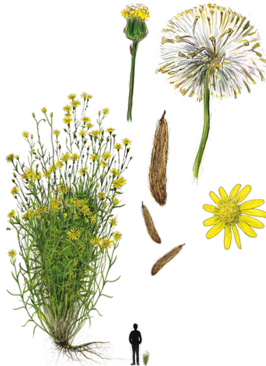
ASTERACEAE FAMILLE BOTANIQUE Astéracées PFLANZENFAMILIE Korbblütler